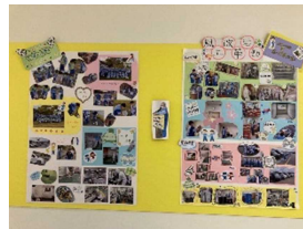
←各横断チームによる活動の成果を見える化した掲示版を作成