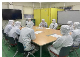
←労使対話会の様子