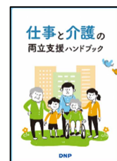
↑各種ハンドブック